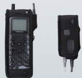
コードレス端末(フックタイプ)／アセンブリ用