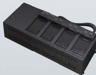
防爆電池パック対応(4ヶ用)